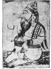
मुख्य हरिकथानिरूपण ।